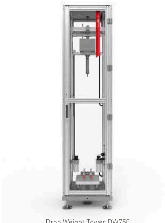
Drop Weight Tower DW750